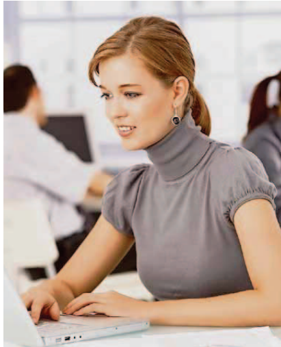
IN NETTA MINORANZA In Svizzera le donne nei CdA delle imprese quotate in Borsa sono solo l'11%.